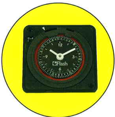
Option : Programmateur hebdomadaire 7 jours

D'une grande adaptabilité, les trémies séchantes TCM peuvent être utilisées de manière individuelle sur châssis au sol ou sur machine, ou comme système centralisé permettant alors l'alimentation de plusieurs machines.